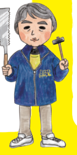
プレイリーダー せんちゃん

遊び心を永遠に 先日、94才の方が「なんぼ年とって、遊んでっどぎが一番幸せよ」と語ってくれました。遊びは、子どもには勿論ですが、大人にも必要です。少年らしい遊び心を持っている人って素敵ですね。あそびあランドは、みなさんの心を童心に返らせてくれます。ぜひ、あそびあランドで思う存分遊んでください。