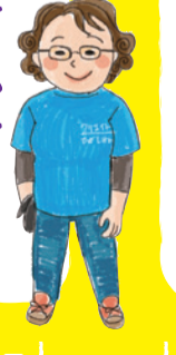
プレイリーダー ほよやさん

あそびあのおばちゃん 7年たつてますますおばちゃんになった。おにぎりに「しゅ〜、むり〜」。山に行こう! 誰か行っておいで。火を焚こう! いいね〜。お湯を沸かそうか! お茶しよう。おしゃべりに花が咲きます。おばちゃんに出来るのは、みんなの隣にいます。