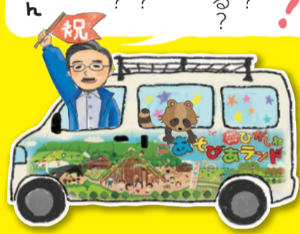
施設長 センチちゃん

あそびあランドに来たらなんでもまかせてみよう! あそびあランドってだれが名前を付けたのか? ギリガニ池のザリガニはどこからやってくるのか? 東根はどうしてサクランボ畑が多いのか? 飛行機はどうして飛べるのか? サントクロースはどこからやってくるのか? あそびあタイムってだれがつくったのか? 不思議に思ったこと、わからないこと、たくさんプレイリーダーに質問して友達になろう!