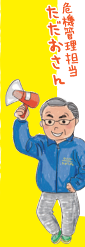
危機管理担当 ただあさん

あそびあランドのお医者さん 遊具を安全快適に利用してもらうために、機能を十分に活用発揮させる必要があります。遊具は時間と共に機能が劣化し破損していきまが、それを防止・補修して機能の回復や美観の向上を図っています。まるで病気やケガをした人を治療するお医者さんのように丁寧に手当てを行い、ある時は手術も必要です。