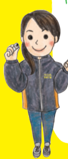
プレイリーダー みくみく

「なにもしない」をしてるんだよ タイトルはくまのプーさんの言葉です。私は芝生でぼーっと寝転ぶ時間が大好き。水たまりをじっと眺める子や居眠りする中高生、まったりとおしゃべりする大人達。体を動かす遊びだけじゃなく、のんびり過ごす時間の中で感じられるものもあります。「なにもしない」を楽しんでみませんか?